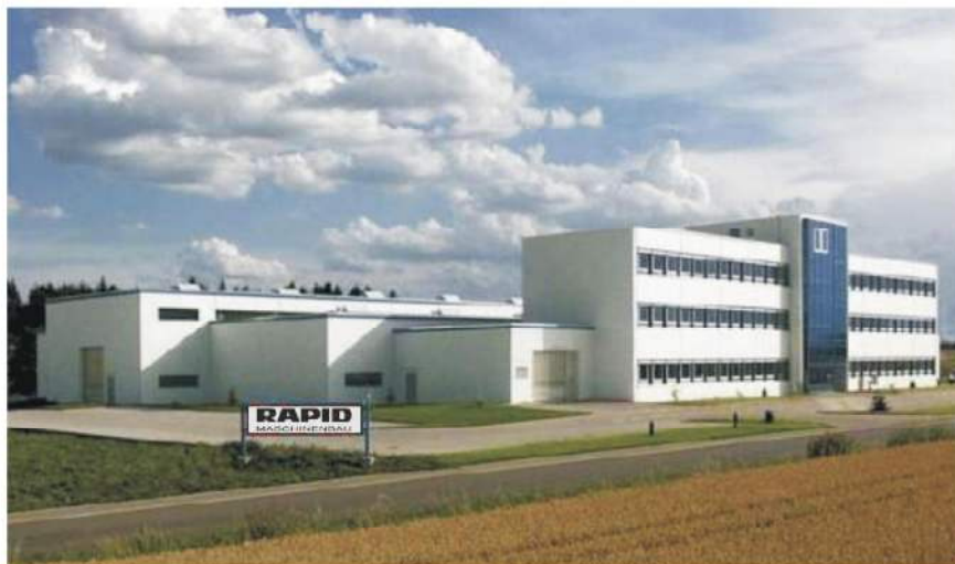
RAPID-Zentrale in Grosselfingen

rapid@rapid-maschinenbau.de www.rapid-maschinenbau.de