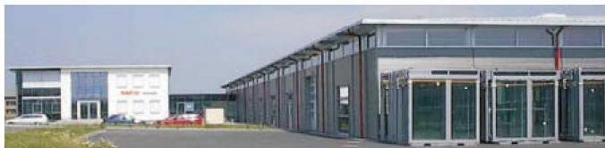
RAPID-Werk in Calau.